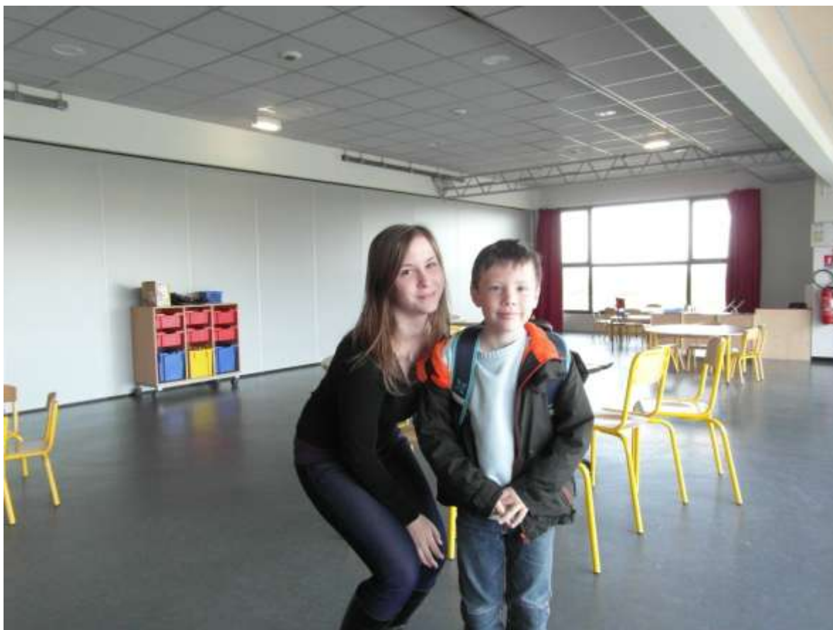
Az iskola és az óvoda reggel 8 órákor megnyitotta kapuit a diákok felé.