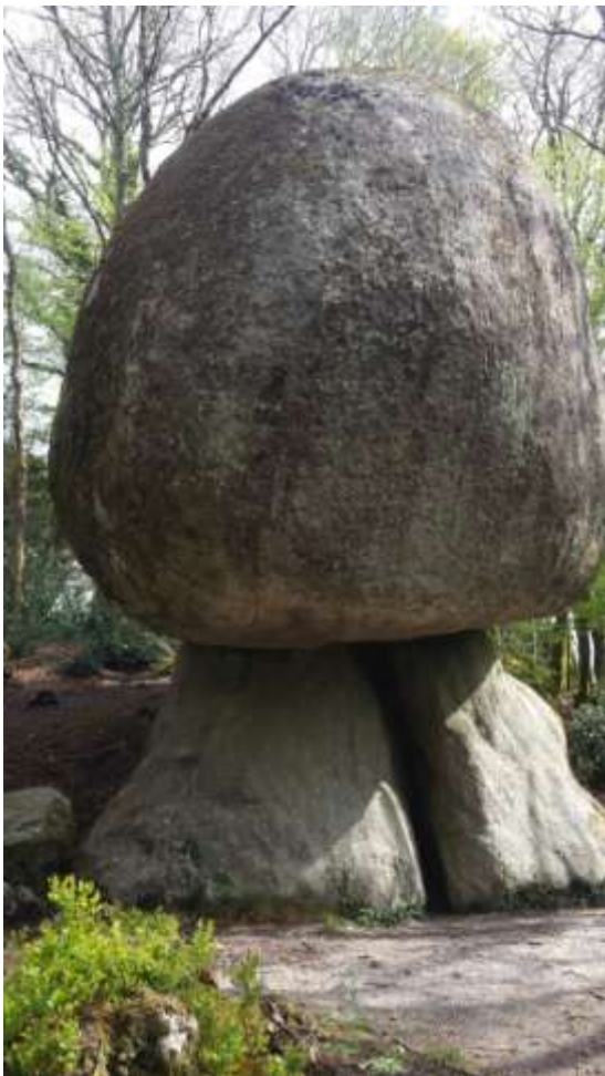
A szikla oldalról.