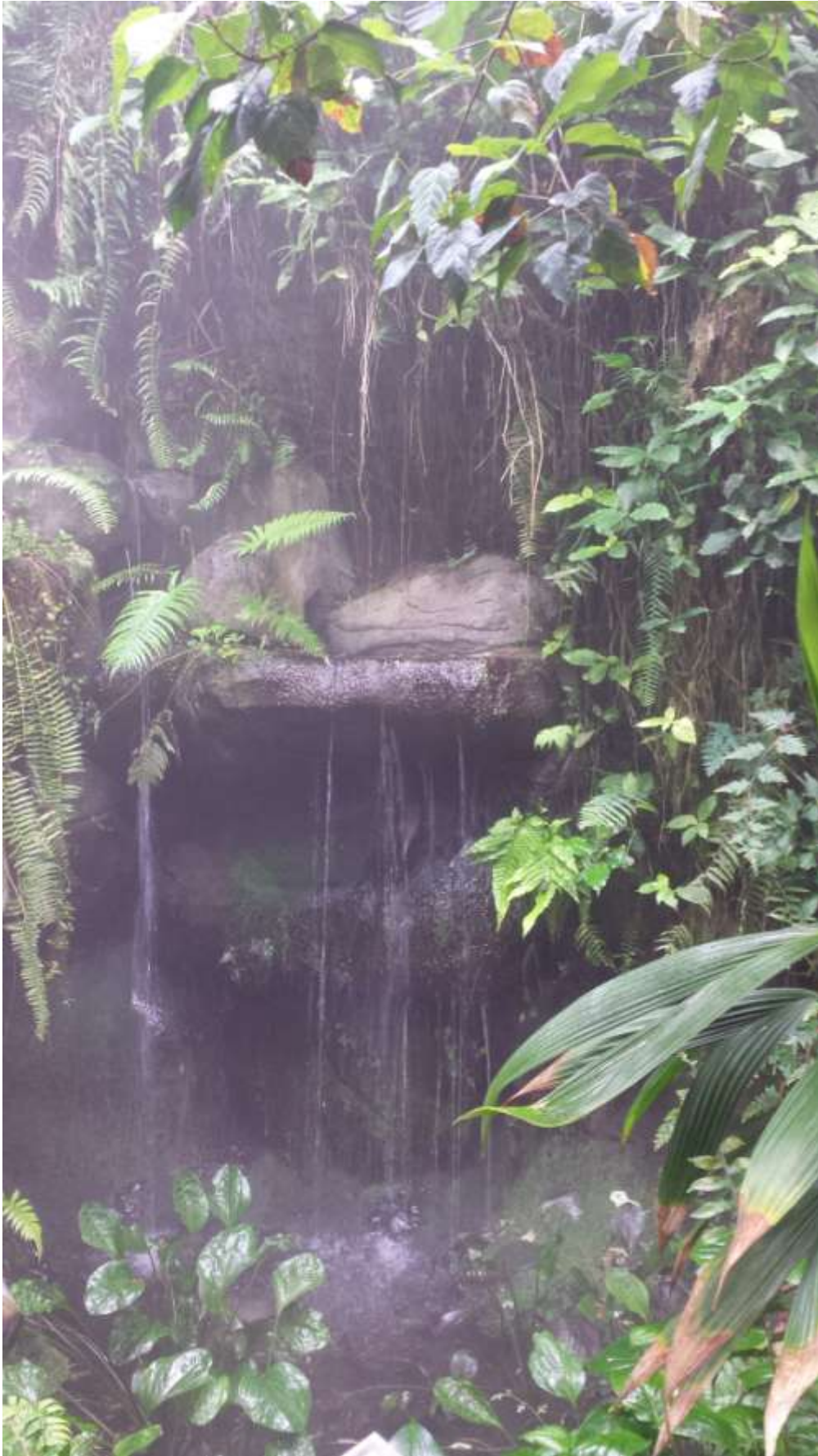
A trópusi esőerdő.