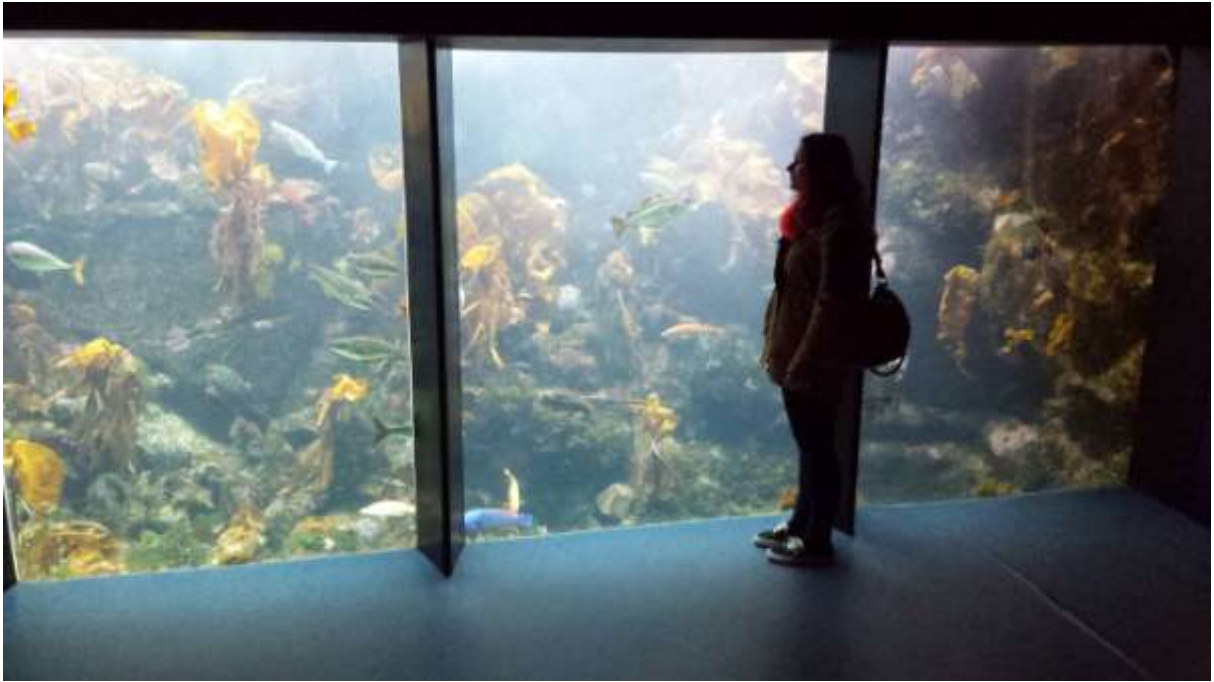
Egy csodás akvárium a Tempéré pavilonban.