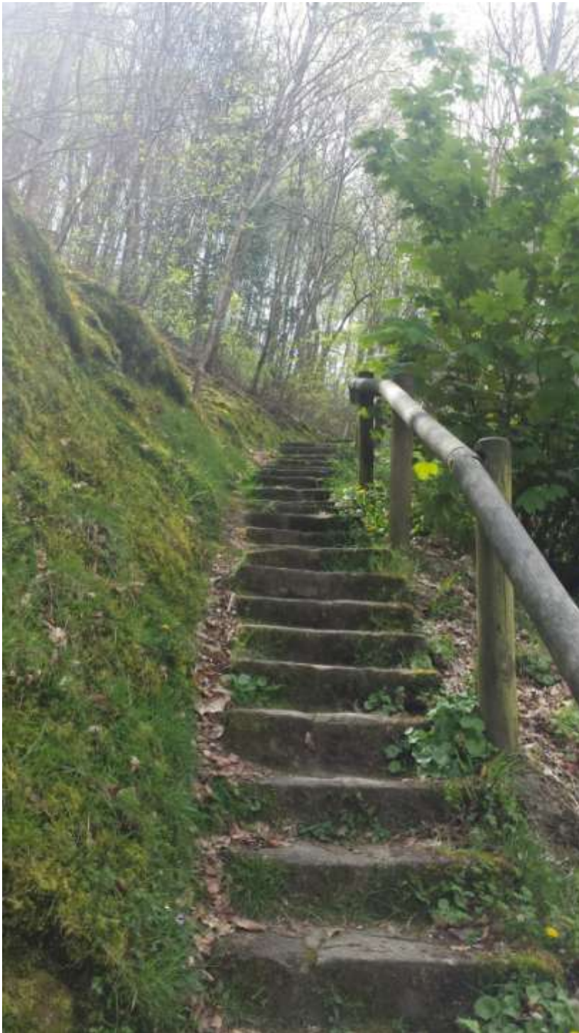
A felfelé vezető lépcső.

Elkezdődött a 3. hét. Húsvét hétfő. Egész nap vasárnap hangulatom volt, mivel ugyanúgy minden zárva volt kivéve a netkávézót és pár palacsintázót. Az időnket kihasználva felfedeztük Quimper látványosságait, többek között túráztunk. Nagyon szép volt a kilátás fentről. Sajnos a húsvét alkalmából csak kalácsot volt lehetőségünk enni.