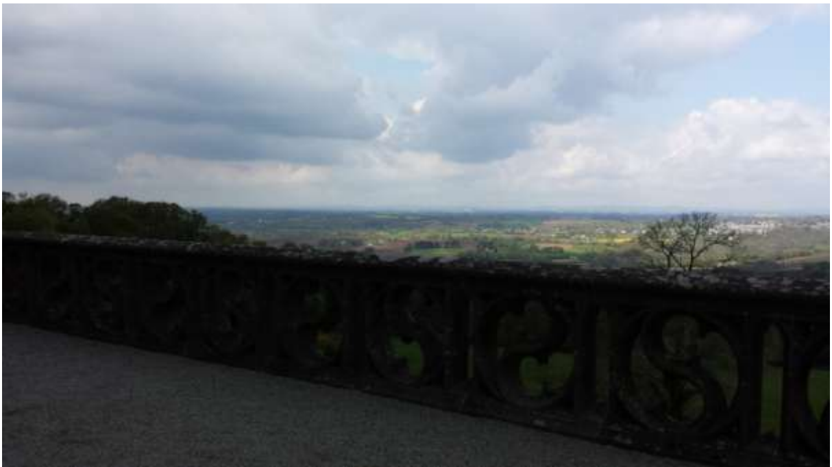
A lenyűgöző panoráma.