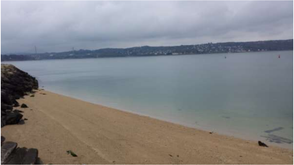
A part és a Brest-i híd.