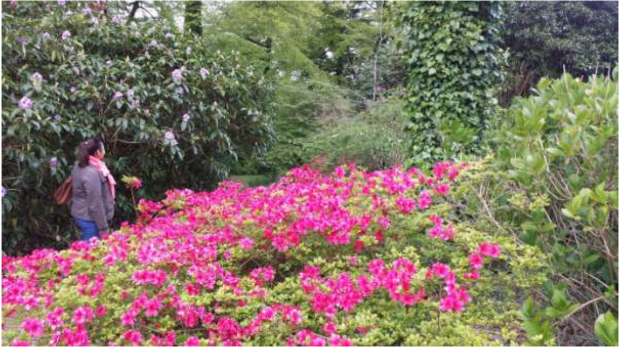
A kastély csodás kertjének kis részlete.