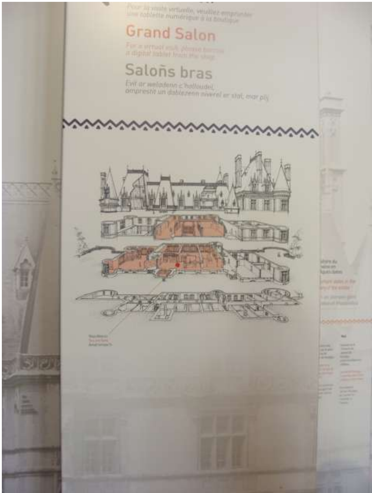
A kastély alaprajza. Sajnos csak az első emelet tekinthettük meg, mert a többi az évek során nem maradt fent.