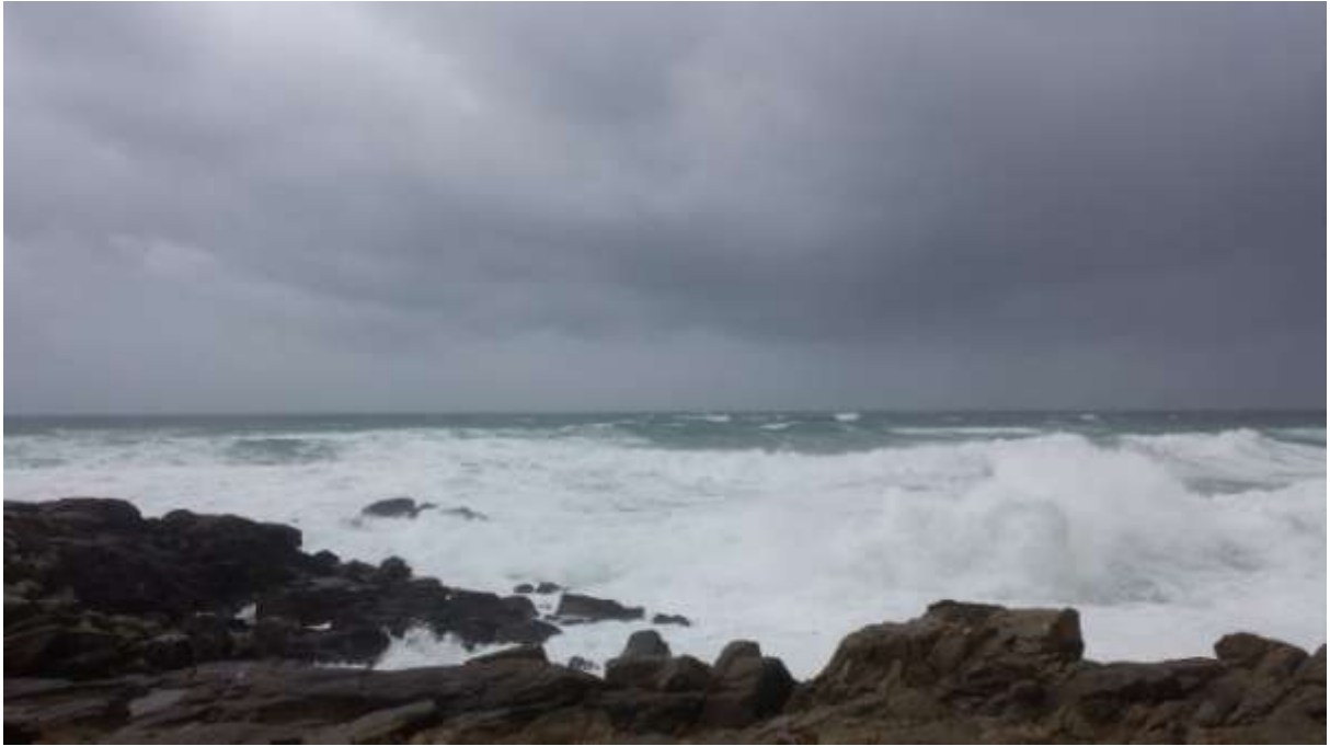
A háborgó óceán Pointe de la Torche-nál.