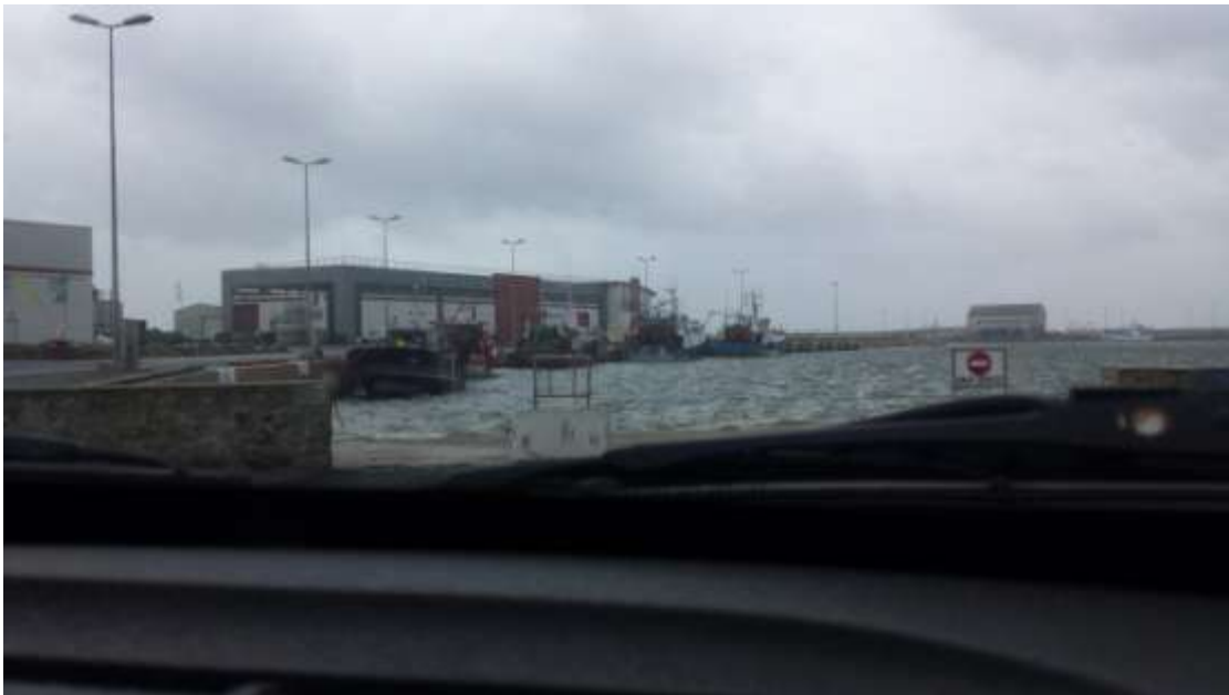
A kikötő és a piac.