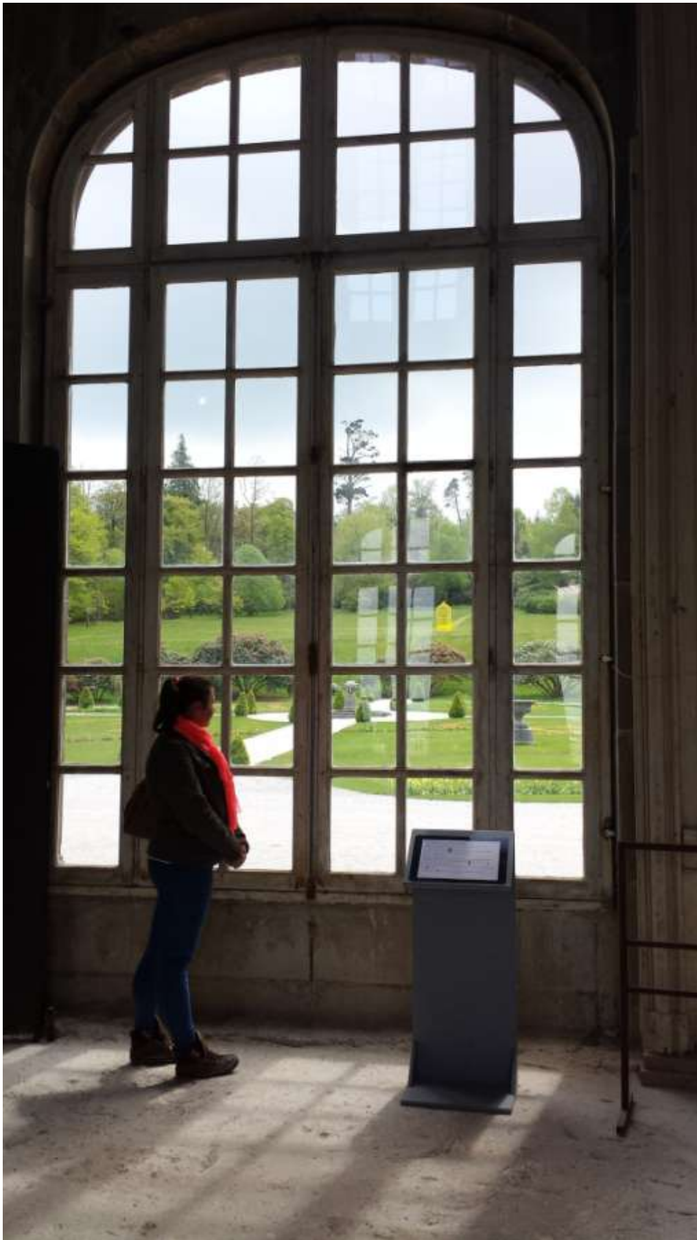
Kedvenceim a hatalmas ablakok.