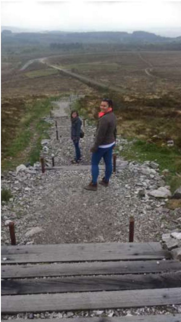
A lefelé vezető út.