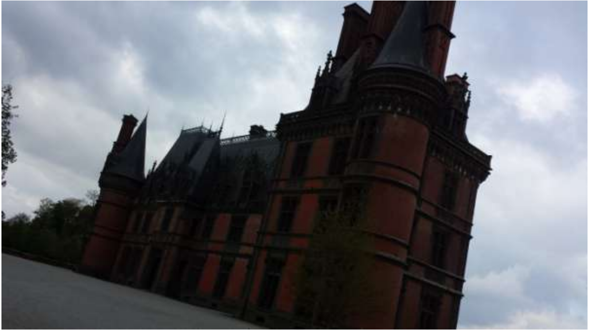
A csodás kastély.