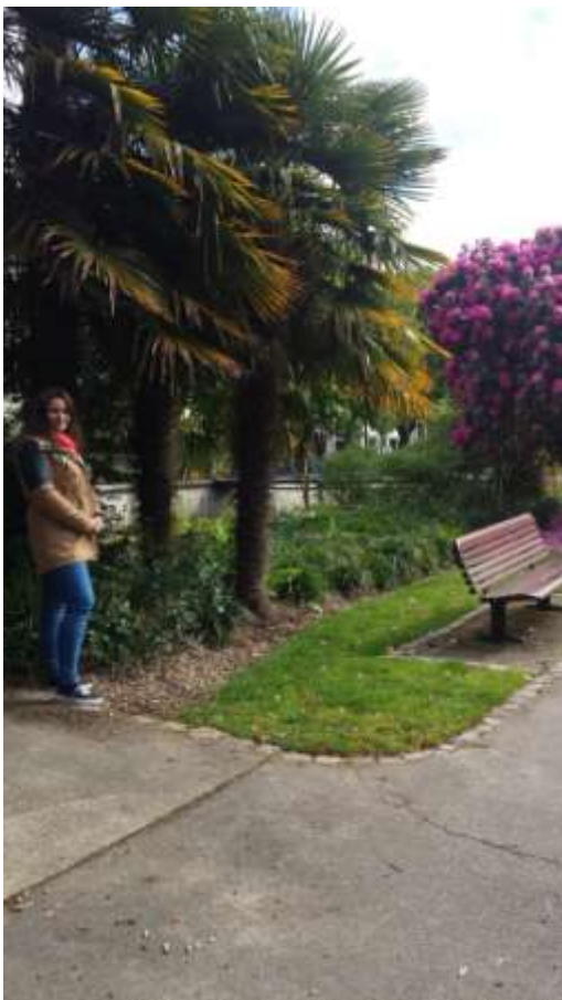
A folyó melletti pálmánál.