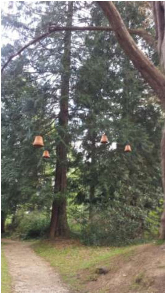
A fákról lógó kis cserepekben hangszórók voltak elhelyezve, melyek a kastély történetét mesélték el franciául.