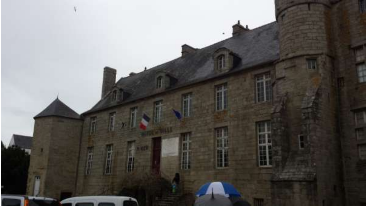
Pont l'Abbé Önkormányzatának az épülete.