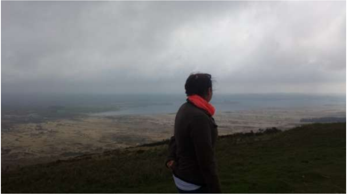
A kilátás 300 méterrel a tengerszint felettől.