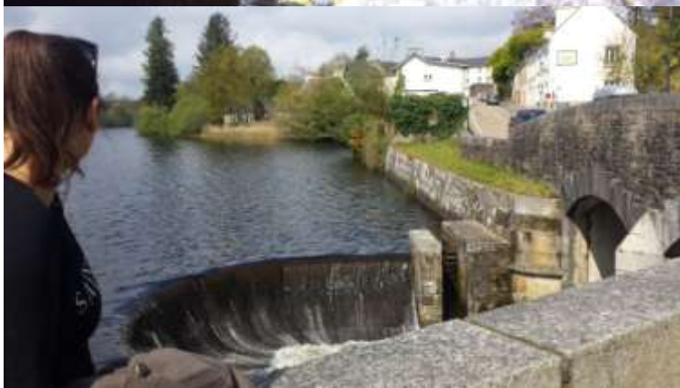
A víz e tóból folyik, mely köré a város épült. A túránk kezdete.