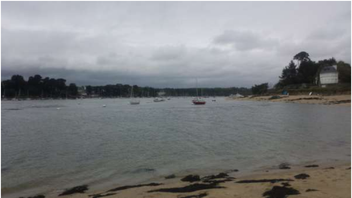
Háttérben a kikötő.