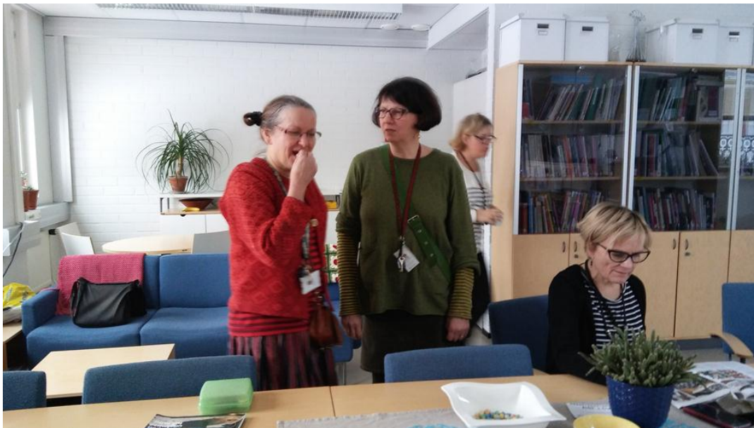
2. ábra tanáriban

A tanárok egy-egy témakört tanítanak, melyeket elosztanak egymás között. Nincs rivalizálás, inkább jó együttműködést tapasztaltam közöttük. Folyamatosan tájékoztatják és segítik egymást. Meglepőnek találtam a tanárok és a diákok keddenkénti megbeszéléseit, ahol mindenkit tájékoztattak az aktualitásokról és a problémák megbeszélésre is volt mód. Itt mutattak be bennünket is a diákoknak.