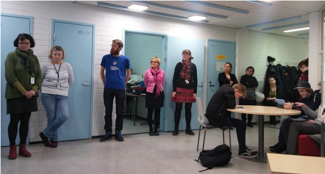
3. ábra Keddi megbeszélés

A tanárok minden segítséget megkapnak a megfelelő felkészüléshez és az oktatáshoz, szakkönyvek, folyóiratok és a termékek elkészítéséhez szükséges alapanyagok a rendelkezésükre állnak. Mindenkinek van iskolai mobiltelefonja, laptopja, a tanításhoz dokumentum kivetítőt, fénymásolót, nyomtatót használhat. Az órákra való felkészülést a tanműhely sarkában kialakított önálló iroda biztosítja, amely tágas és számítógéppel is ellátott. Az üvegfalon keresztül a tanár belátja az egész tanműhelyt, az ott folyó munkát.