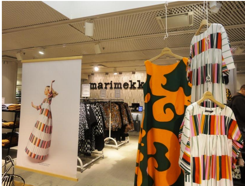
15. ábra Marimekko üzletben

Szabadidőnkben lehetőségünk nyílt ellátogatni több finn városba is. Ellátogattunk a helyi Marimekko üzletbe és megcsodáltuk a letisztult, egyszerű mintákat és modelleket. Sajnos az árak miatt csak- egy - egy bögrét vásároltunk.