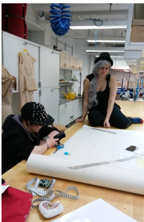
5. ábra Szabásminta készítés

Egy szövődei órán a takácsoknál voltunk (2. évf.), ahol a tanárnő egy kétrétegű szövetminta segítségével és kivetített kötésrajzzal magyarázta el a kötésszerkezet kialakítását. A diákokkal együtt - kérdez-felelek módszert alkalmazva - készítették el a szövőszék nyüstbefűzési és bordabefűzési sorrendjét. Ez alapján önállóan tervezik meg az elkészítendő mintadarabjukat, de természetesen a tanári segítséget időről-időre igénybe veszik. A gyakorlati kivitelezéskor az önálló munkavégzésen van a hangsúly. A tanárok egy-egy hibánál összehívják a tanulókat és magyarázattal, rávezető kérdésekkel segítik őket. A projektfeladatok kidolgozásával és megvalósításával szerezhetik meg az érték járó kreditpontokat és léphetnek tovább a következő feladathoz.