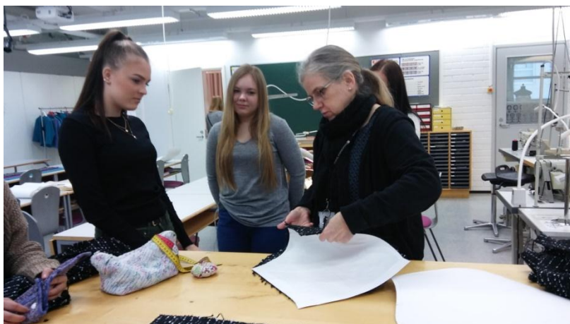
6. ábra Hibajavítás, varroda

Mindenki a saját tempójában haladhat. Mivel a tanulási folyamat projekt feladatok és nem tantárgyak köré rendeződik, fejlődik a kreativitásuk és a problémamegoldó képességük. Megtanulnak önállóan, de egymást segítve dolgozni. A tanár partnerként kezeli őket, ami nem okoz feszültséget a tanulás folyamatában.