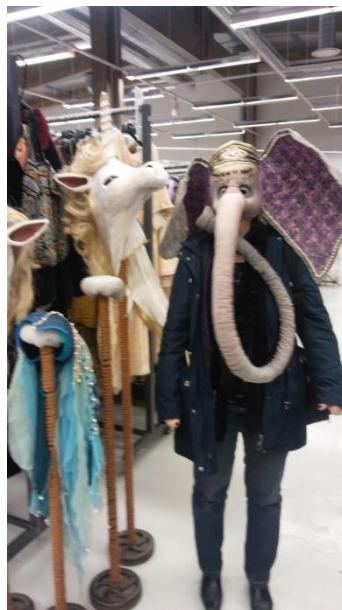
10. ábra Jelmezben

Fő profilja a jelmezek kölcsönzése, javítása, átalakítása. Rendszeresen fogadnak diákokat és adnak megrendelést az iskolának. Nemrégiben rokokó női ruhákat terveztek, amit a végzős diákok varrtak meg. Ottlétünkkor éppen a báli szezonra elkészült frakkokat szállította le az iskola és ezek átvétele zajlott. Mint megbeszéltük, ez a rendszer, ahogy a diákok felveszik a megrendelést és elkészítik, költségeket számolnak, számláznak kicsit hasonlít a nálunk is működő diákvállalkozásokhoz.