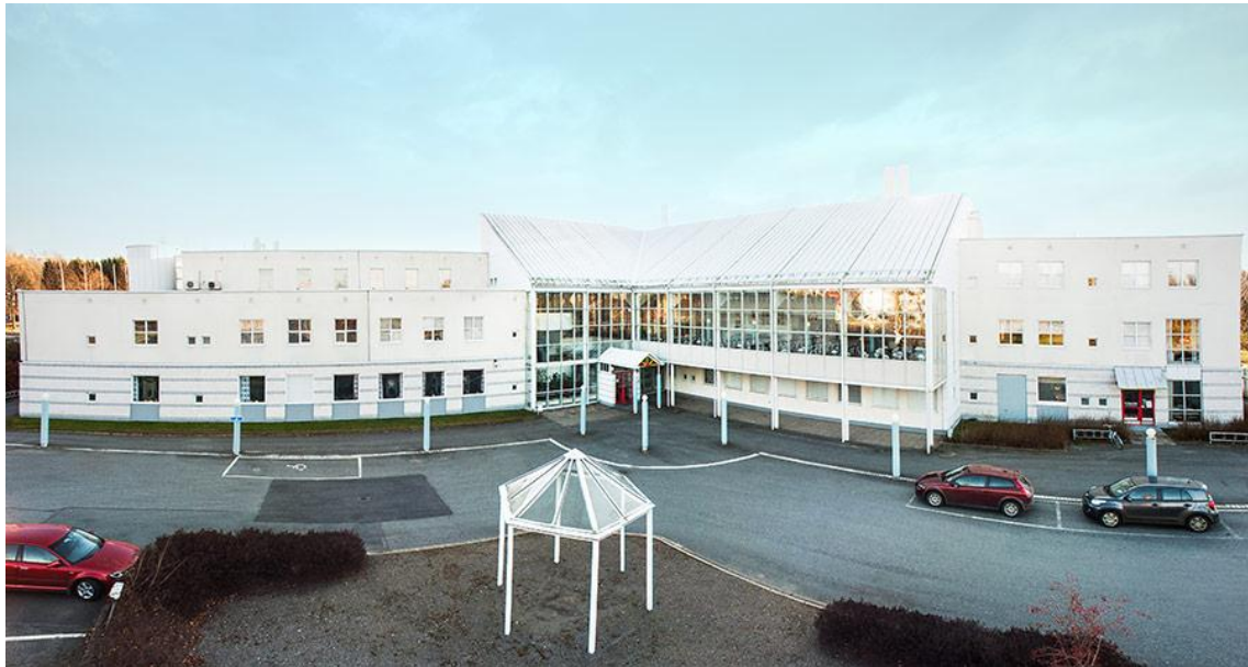
1. ábra A hämeenlinnai iskola főépülete

A Koulutuskuntayhtymä Tavastia (Tavastia Oktatási Konzorcium) 6 egységből áll, ennek egyike a Hämeenlinnában lévő iskola, amely egy középszintű szakképző intézmény.