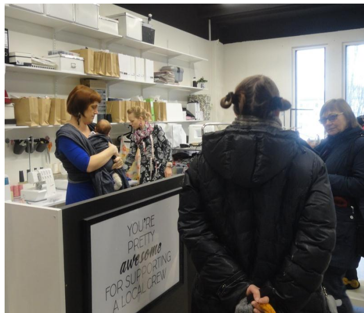
14. ábra Vállalkozónál