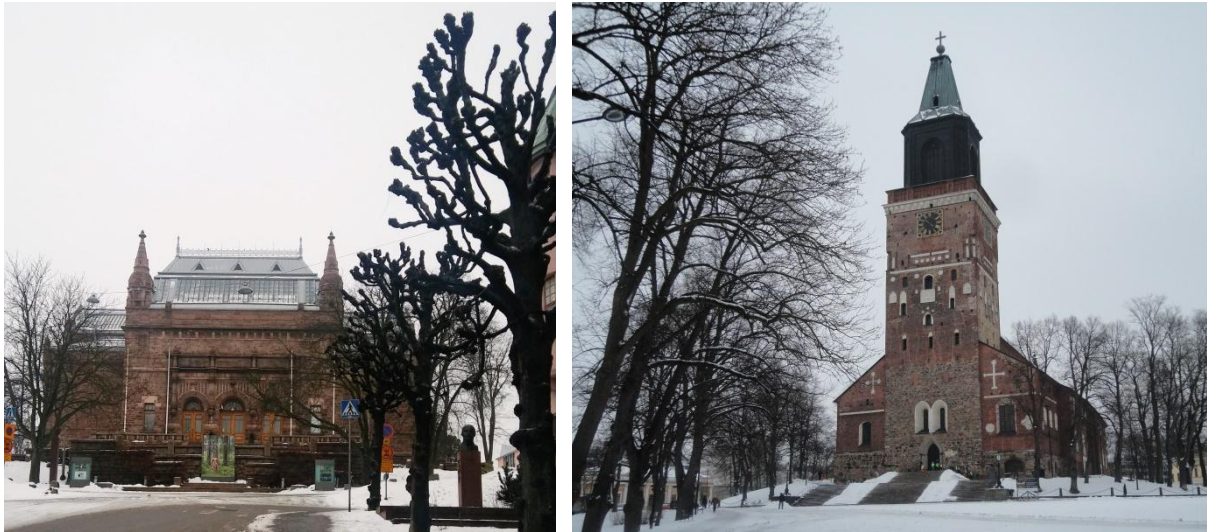
17. ábra Művészeti kiállítás és a Katedrális

Katedrális, Fiatal művészek utcája, Aurajoki folyó hídjai, Vartiovuori Csillagvizsgáló, Luostarinmäki Skanzen, Szélmalom (Samppalinnan mylly).