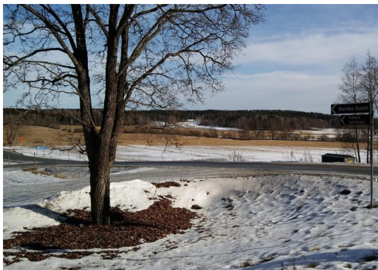
19. ábra a Skanzen környéke