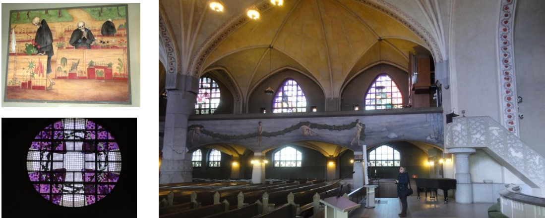
18. ábra Katedrális

Näsinneula kilátótorony, Katedrális, Finlayson Templom, Művészeti múzeum, Belváros kézműves műhely