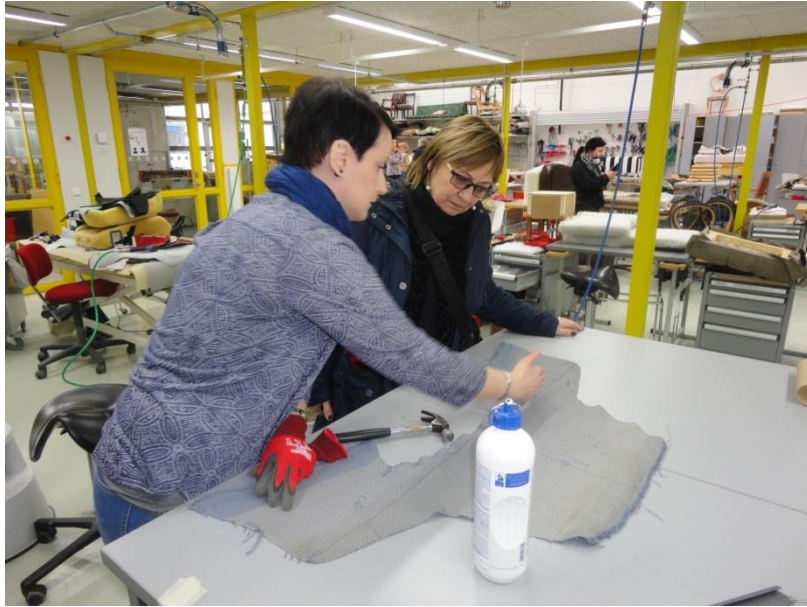
9. ábra Kárpitosoknál