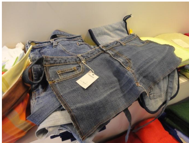
12. ábra Kötények

Itt a sérült embereknek adnak munkalehetőséget, kézműves termékeket állítanak elő. Hulladék anyagokból készítettek konyharuhákat, párnákat, kistáskákat, bevásárló szatyrokat. Az iskola diákjai tervezték meg a varrandó termékeket és készítették, szabásmintákat. Az iskola a hulladék anyagokból, cserébe válogathat saját részre, melyeket külső cégektől kaptak. Tetszett, hogy mások „megunt ruháiból” is készítettek termékeket, így nagy hangsúlyt kap a hulladékfeldolgozás. Ott jártunkkor a diákok tervei alapján régi farmerokból kötényeket készítettek. A megvarrt termékeket egy kisboltban árusítják, kefe és seprűkészítők munkáival együtt.