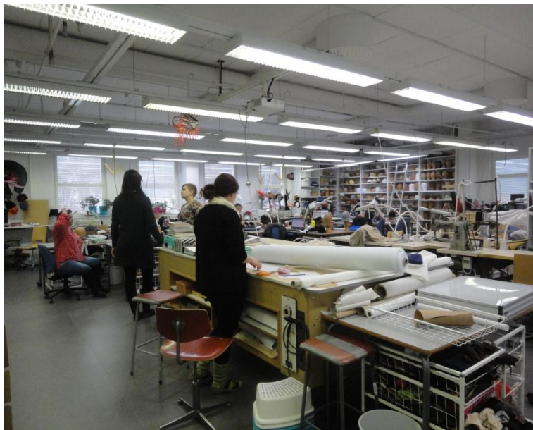
8. ábra Kalaposoknál

Részt vettünk több szakmacsoport óráján is. Legtöbb órát a varrodában töltöttük különböző csoportoknál, de voltunk a kárpitosok, kalaposok, takácsok óráin is. Megnézhettük, hogy a különböző korcsoportokkal, eltérő évfolyamos diákokkal hogyan foglalkoznak az oktatók.