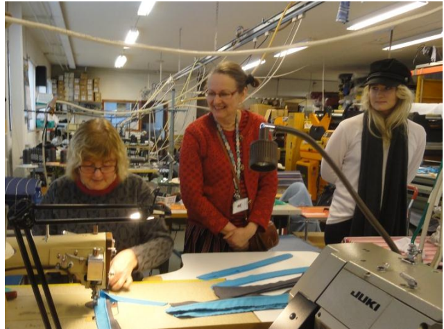
11. ábra Bérmunkába dolgozó varrodában