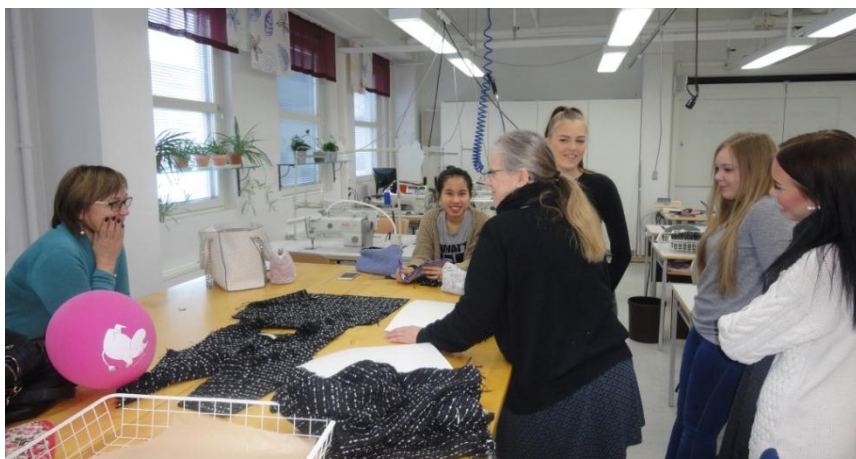
7. ábra Technológiai sorrend megbeszélése

A tanulók vállalkozási kompetenciáját fejleszti, hogy külső megrendelőknek gyárthatnak termékeket. Természetesen a tervezéstől, a kivitelezésig és a költségek kiszámításáig mindent nekik kell elvégezni. Ezt az egyéni vállalkozás működtetéséhez fontos megtanulniuk. Mindezt fokozatosan tanulják meg. Az elsőévesek először csak az iskola üzletébe készíthetnek termékeket és ekkor még a tanárnő végzi a költségek kiszámítását. Így bárki megnézheti és megvásárolhatja ezeket a termékeket, ami sikerélményt és kritikát is jelent a tanulóknak.