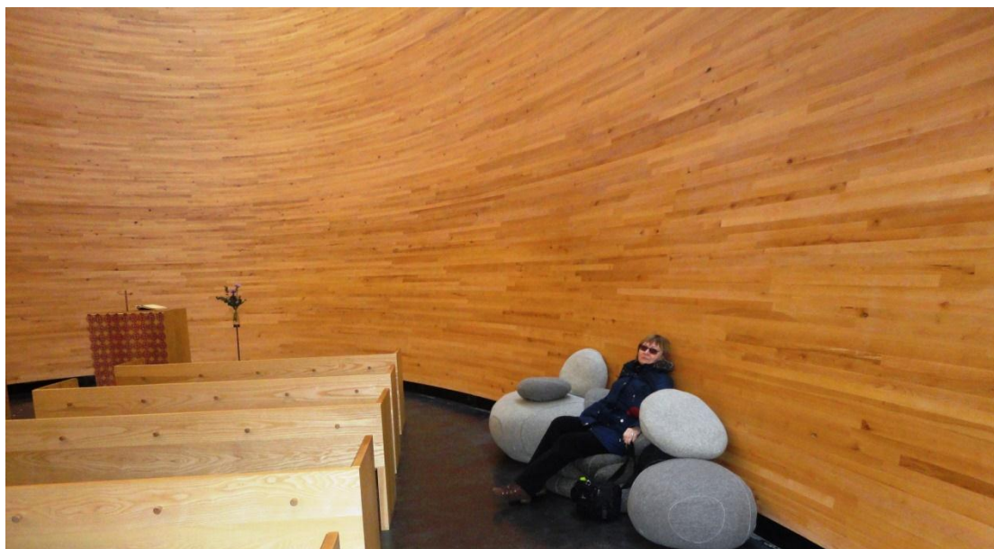
16. ábra Kamppi Chapel

Természettudományi Múzeum, A csend temploma (Kamppi Chapel), Hajókötő, Suomenlinna erődítmény, Belvárosi séta.