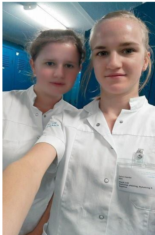
Tájékoztattott minket a heti programunkról.