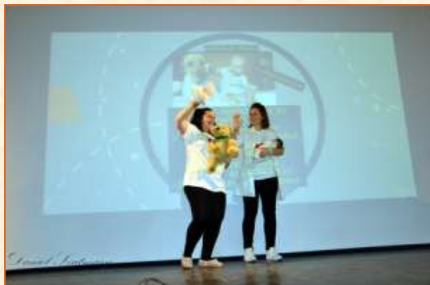
2. Kisgyermekgondozó és -nevelő