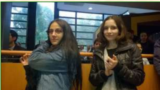
A lányok az eredményhirdetésen