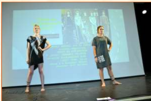
3. Divat- és stílustervező