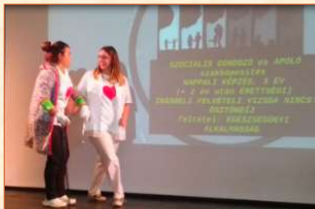
4. Szociális gondozó és ápoló

Ezt követően pedig a kedves érdeklődők megnézhatték, hogy a divat- és stílustervezők milyen ruhákat készítettek (galériánkat ld. a következő oldalon). Zárásul pedig zenés flash mobbal fejeztük be a félórás összeállításunkat. Tökéletes produkció, jó hangulat, összetartás és ZENE született a színpadon.