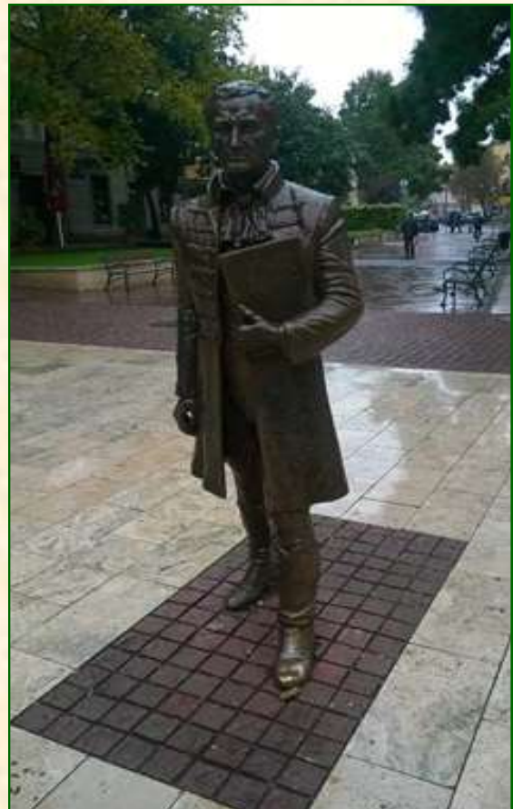
Kazinczy Ferenc sátoraljaújhelyi szobra