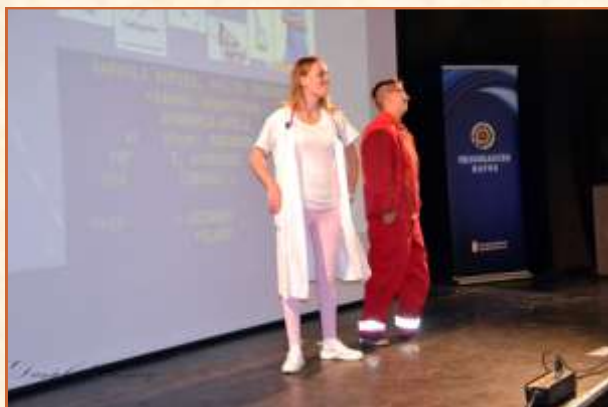
1. Gyakorló ápoló és mentőápoló

A mi iskolánk is részt vett ezen az eseményen, nem is akárhogyan. Először is különböző szakmák bemutatásával jelentünk meg a színpadon.