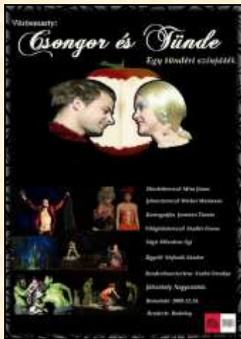
A Szegei Múzsák csapat versenyfeladat-plakátterve