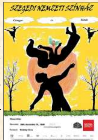
A Minerva csapat versenyfeladat-plakátterve

– Egy nagy klasszikus címszerep eljátszása mindig nagy feladat elé állítja a színészt, velem sem volt ez másképp, de természetesen nagyon örültem a meg-