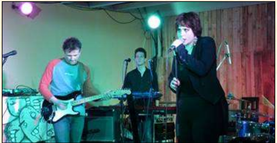
a Honeybeast a Kuplungban

Megosztottak a vélemények A Dal kimenetével kapcsolatban, egyesek kedélyeit felborzolta, a külföldiek meg oda vannak meg vissza. A közép-döntő után úgy gondoltam, itt a Honeybeastnek most törvényszerűen vége van. A továbbjutás arra volt jó, hogy Zsófit végre hallhattuk a megszokott zsírprofi módon. De valójában számomra egyértelmű volt, hogy ennyi volt.