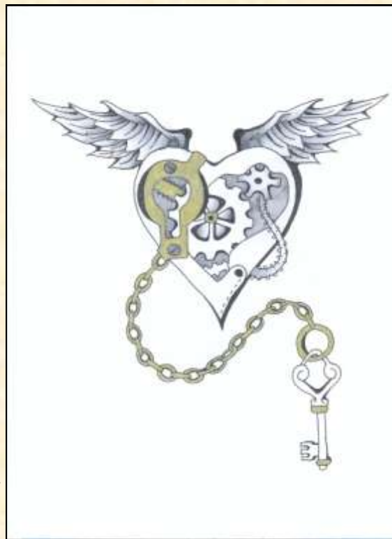
Fekete Zsófia rajza