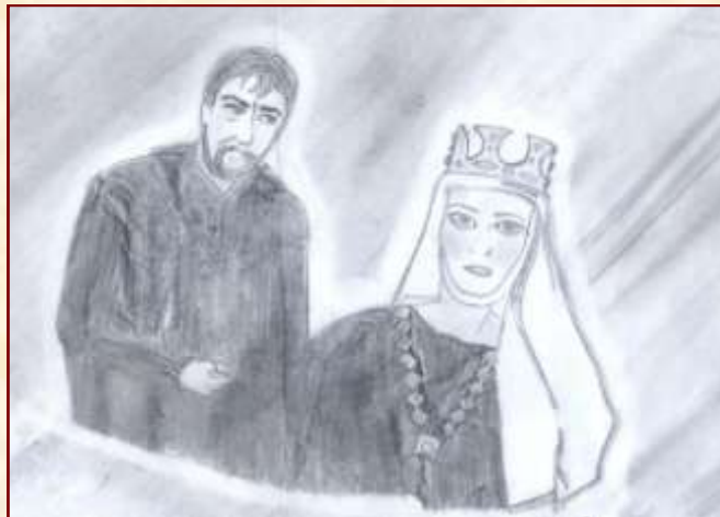
Nadobán Kitti illusztrációja

Bánk és Melinda összevesznek. Bánk nagyon zavart és dühös. Úgy érzi, kezdi elveszteni az ép elméjét. Megsajnálja Tiborcot, aki egy szegény öreg ember, akinek semmi nem jutott az életben. Biberach Ottó ellen fordul, és el akarja hagyni őt, de Ottó dühében leszúrja.