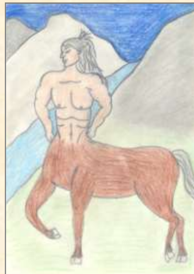
Kovács Karolina rajza

Árva májas kenyér, és elárvult virsli Árva lelkem csak nézi nézi Testem monoton rág, és eszi A fránya lelkiismeret, hogy mára csak ez jut. Utána szaladj ki hányni, az egész világgal kergetőz- ni, akárkinek levetkőzni, a papnak mentegetőzni. Uram, csak vagyok, csak vagyok Csak legyek, csak legyek. Elárvult világban, lélekcafatok rajta légy szaglászik, és új életre vágyik ez tökelütött árva dögevő meg van az egy és meg van a velő