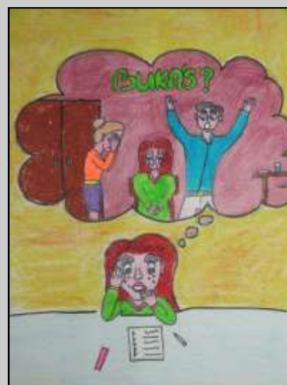
Kovács Karolina illusztrációja

Most itt vagyok végre tizedikben, és soha többet nem akarom megtapasztalni ezt az érzést, nem akarok még egyszer átmenni ezen. Elvesztettem egy évet az életemből, és ezt soha nem fogom visszakapni. Remélem az én hibám tanulság lesz másoknak is, és sikerekben gazdag éveket kívánok mindenkinek!